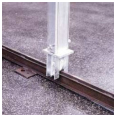
Auf Rollen, fahrbar