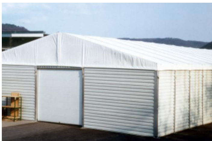
Blechwandverkleidung mit Rolltor