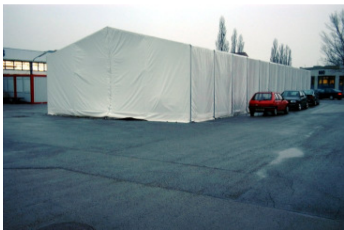
Euroflex freistehend auf Asphalt