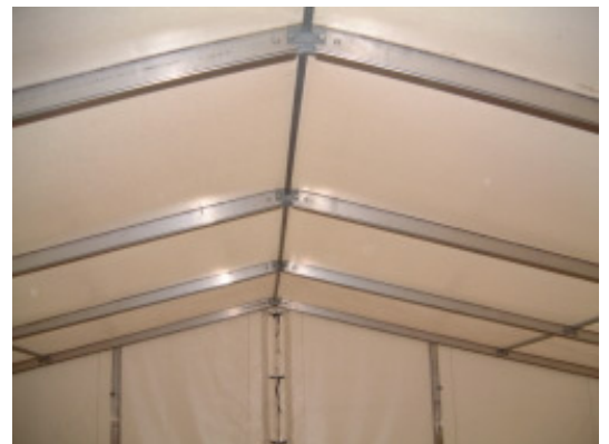
Innenansicht der Gerüstkonstruktion