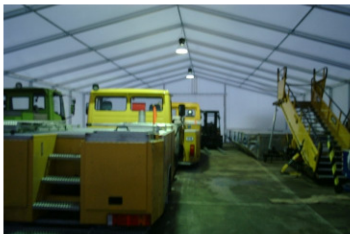
Innenansicht mit Beleuchtung